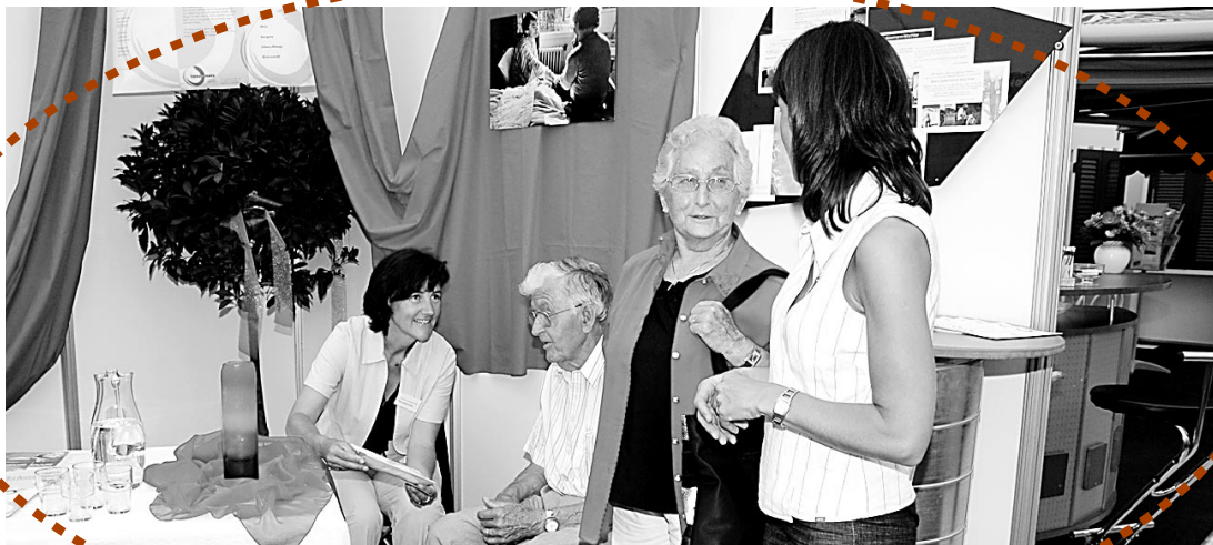
Sie bieten ihre Hilfe an: Die ökumenischen Hospizgruppen des Sarganserlandes werden am Samstag nochmals an der Siga beraten. Sie sind am Stand von Ackermann Bestattungen anzutreffen.