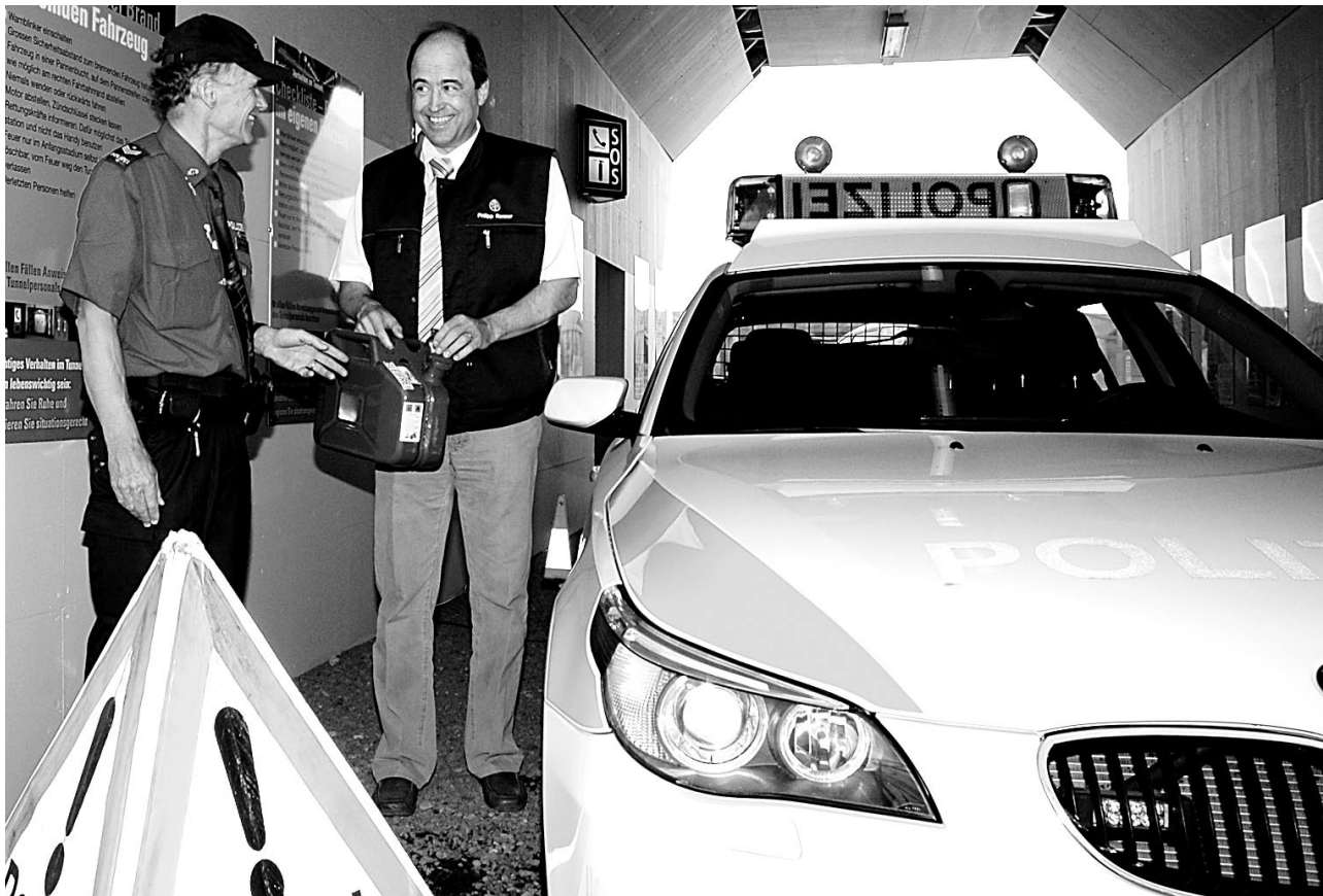
Sie arbeiten für die Sicherheit im Tunnel vorbildlich zusammen: Der Touring-Club und die Kantonspolizei demonstrieren ihre Hilfsbereitschaft zugunsten der Autofahrer.